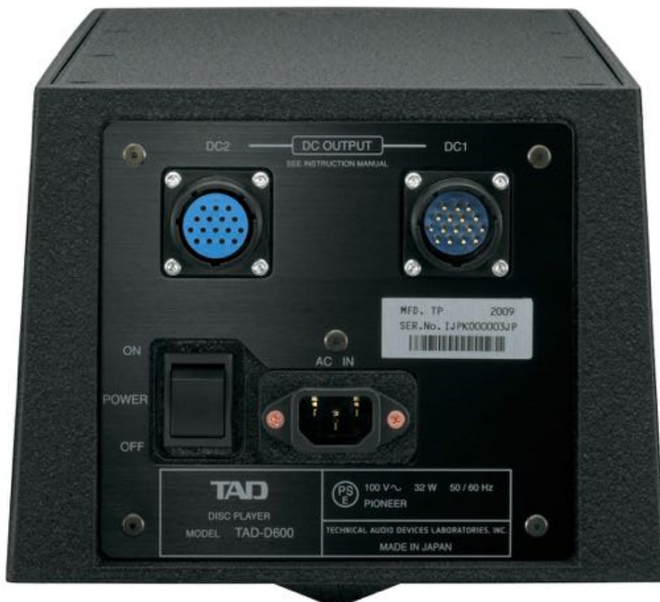
Face arrière de l'alimentation et télécommande