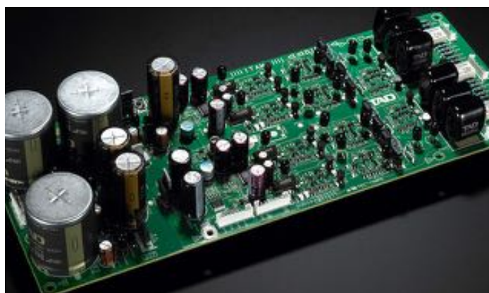
Circuit de sortie

Le D600 utilise un nouvel oscillateur à cristal breveté qui améliore le niveau de bruit de plus de 50 dB par rapport aux appareils concurrents, atteignant ainsi des caractéristiques C/N extrêmement élevées. TAD s'est concentré spécifiquement sur le rapport C/N afin de fournir la capacité de reproduction sonore la plus précise, visant à réduire complètement le jitter dans les bandes latérales de basses fréquences par rapport aux fréquences centrales. L'oscillateur à quartz a été développé en coopération avec un fabricant de quartz. Basé sur des technologies développées pour les installations de relais de stations de base numériques à grande vitesse, cet oscillateur est parfait pour le D600.