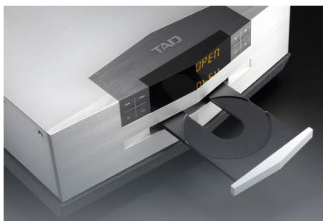
Tiroir en aluminium

Pour obtenir une alimentation électrique très stable, un transformateur puissant est nécessaire. Après une série complète de tests d'écoute avec différentes capacités d'alimentation électrique, un transformateur toroïdal de 400VA a été sélectionné. D'une puissance comparable à celle des transformateurs utilisés dans les amplis de forte puissance, il permet d'atteindre un niveau de performance incroyablement élevé pour un lecteur de CD.