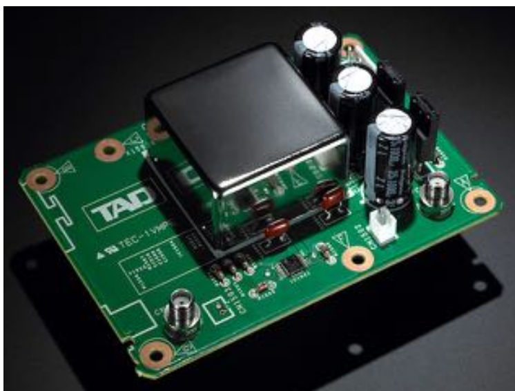
Horloge maîtresse UPGC