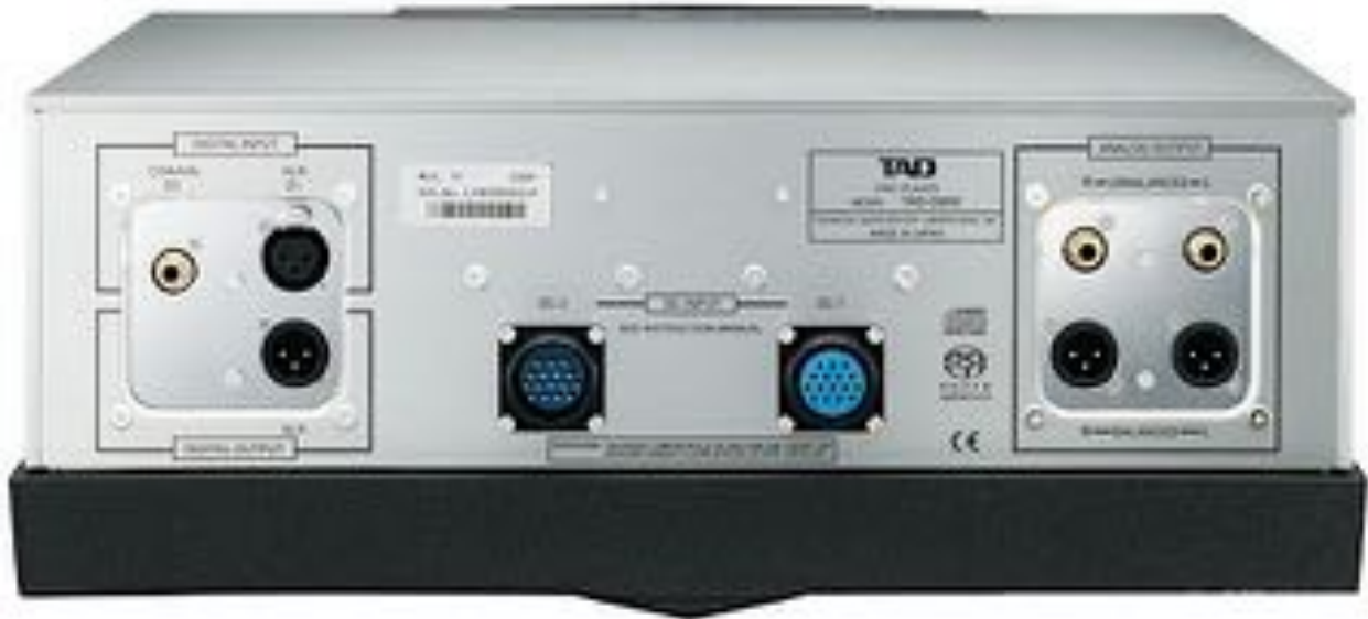
Face arrière du D600

- La sortie numérique (convertie à la fréquence d'échantillonnage de 88,2 kHz) dépasse les performances du format CD pour une reproduction sonore de haute qualité.