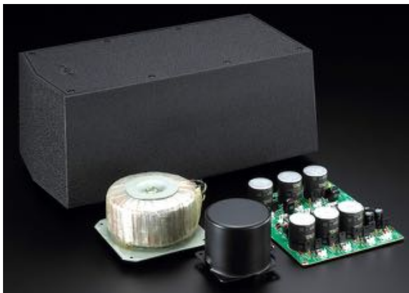
Alimentation de forte capacité