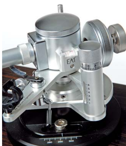
Le fabuleux bras E-GO, facilement ajustable et doué de qualités musicales exceptionnelles.

Médium : Les performances en termes de richesse de détails et détourages des sources sonores ravissent tout auditeur attentif : la présence des voix et le contenu émotionnel de celle de John Martyn sur son fabuleux album Grace and Danger font preuve d'un naturel époustoufflant. On retrouve la même impression sur le contenu harmonique des caisses claires de Phil