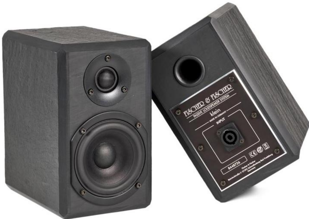
La petite Klein récolte des points supplémentaires pour l'utilisation des sympathiques connecteurs Speakon. Les cordons nécessaires sont livrés avec l'enceinte.