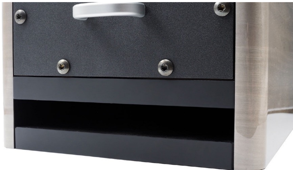
Évent de la charge bass-reflex en partie basse arrière