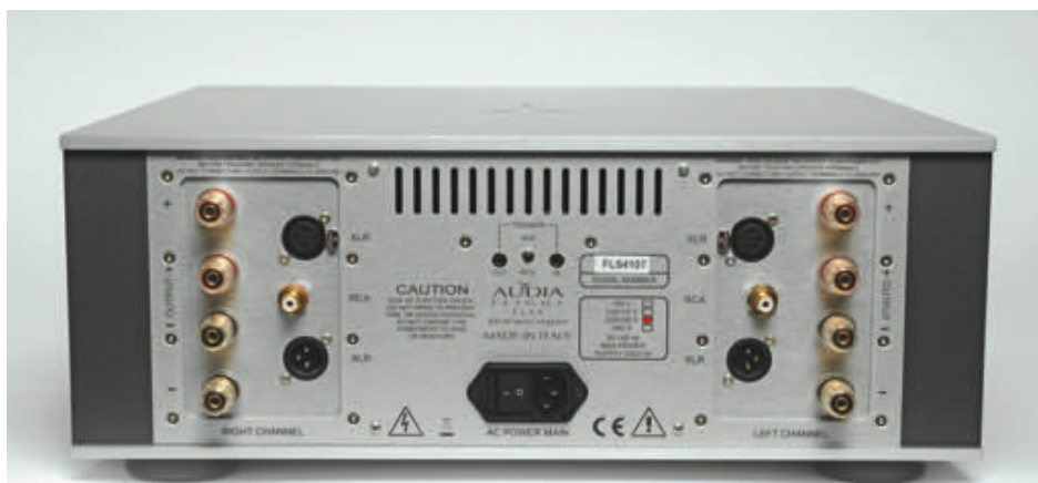
En haut, le FLS1 affiche complet. Noter le réglage par DIP sur la carte phono ; la carte DAC propose 5 entrées. Les entrées et sorties RCA + XLR sont alignées comme à la parade. Le FLS4 dispose d'une double paire de borniers par canal pour le bicâblage.