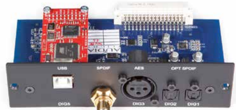
Das optionale Digitalmodul kostet 360 Euro extra und wird in eine sonst von einer Blende verschlossene Öffnung auf der Rückseite gesteckt.

gehen. Betreiber des Digi-In-Einschubs können dagegen während des Spielens etwa die Filtertypen austauschen und haben so den Direktvergleich. Am besten funktioniert das per Fernbedienung vom Hörplatz aus. Einfach die Rubrik „Set PCM Filter“ im Menü aufrufen und dann mit den „+/-“-Tasten hin- und herschalten, bis einem die Finger von den kleinen, druckharten Tasten wehtun.