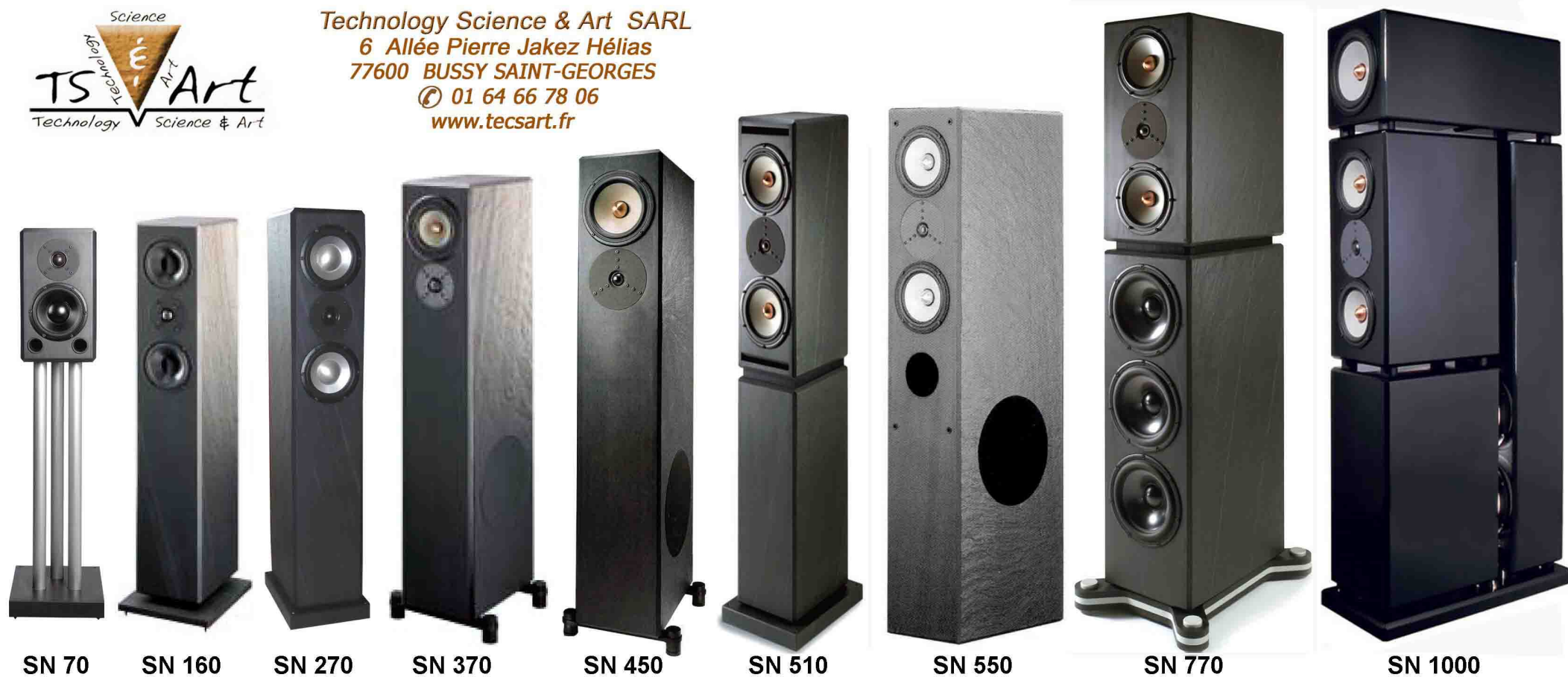
SN 70 SN 160 SN 270 SN 370 SN 450 SN 510 SN 550 SN 770 SN 1000